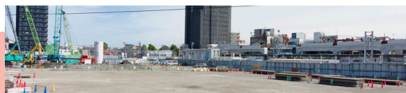
立石駅北口再開発工事一区が床を購入予定の東棟の建設は始まっていません。

庁舎移転、スタジアム建設など、大型開発を見直せば営業を応援する財源はできます。また葛飾区には1300億円の積立金があります。