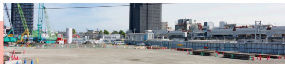
立石駅北口再開発工事一区が床を購入予定の東棟の建設は始まっていません。

庁舎移転、スタジアム建設など、大型開発を見直せば営業を応援する財源はできます。また葛飾区には1300億円の積立金があります。