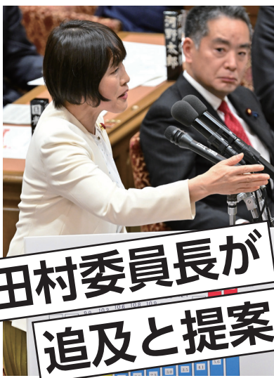
勤労者世帯の年収別の税負担率