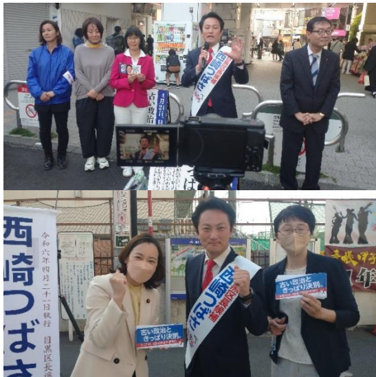
上 市民と野党の共同街頭宣伝(19日) 下 吉良よし子参議院議員(左)、里吉ゆみ都議と(14日)

「今の目黒区政を変えたい」と、「みんなの目黒区をつくる会」（みなめぐ）を結成し、イベント「どうする目黒区2024」や、勉強会を開催。子育て、保育、高齢者福祉、区民セ