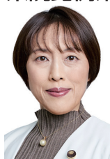
田村 智子 党委員長・参院議員