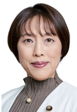
田村 智子 党委員長・参院議員