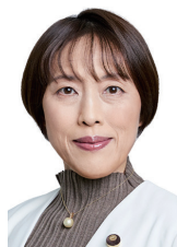
田村 智子 党委員長・参院議員