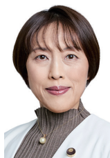
田村 智子 党委員長・参院議員