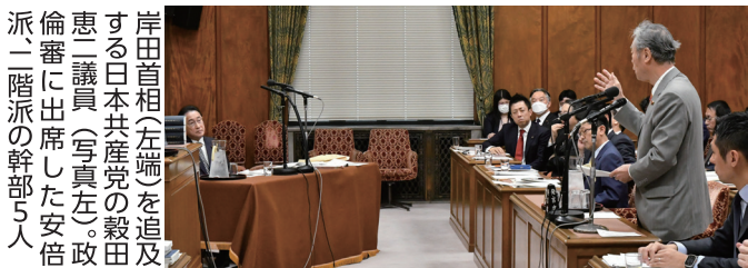
岸田首相（左端）を追及する日本共産党の穀田恵二議員（写真左）。政倫審に出席した安倍派、二階派の幹部5人