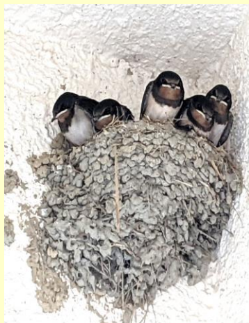
巣立ちを待つ式根島の燕のヒナたち