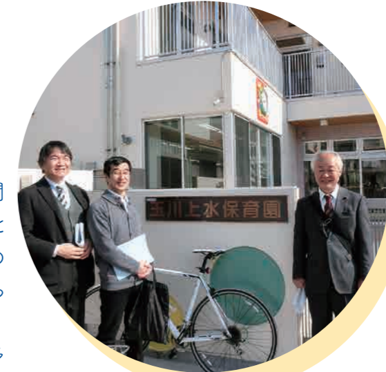
2014年開園間近の玉川上水保育園で