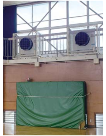
学校体育館は災害時に避難所になる場所です。さらに「学童クラブの遊戯室にも」と求め設置が実現しました。