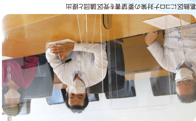
葛飾区にコロナ対策の要望書を党区議団と提出