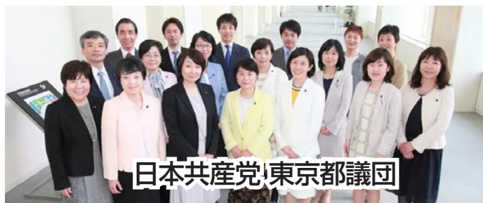
日本共産党東京都議団

コロナの感染拡大のなか、必死になって救急搬送を担当してきた消防職員らの負担が、いっそう増すことが懸念されます。コロナで苦しむ都民の状況や現場の苦労を理解しているのでしょうか。都は開催都市としてきっぱり五輪の中止を決断し、コロナ対策、ワクチン接種に集中すべきです。