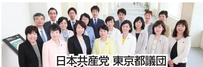
日本共産党 東京都議団