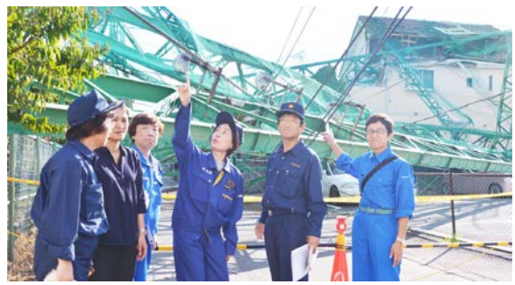
▲ゴルフ練習場の柱がなぎ倒された現場を調査する国会、地方議員ら＝12日、市原市

台風15号による大規模停電や断水、住宅の損壊、浸水、農業被害など甚大な被害が、東京都の大島町や新島村などの島しょ地域や、千葉県などで発生しています。今後も被害の拡大、長期化が懸念されます。被災されたみなさまに心よりお見舞いを申し上げます。