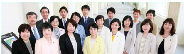
▲ 18人の日本共産党都議団

まだ負担が残っている畳表の取替えなど、さらなる負担軽減が必要です。そのために全力をあげます。