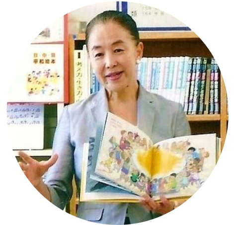
吉良よし子参院議員