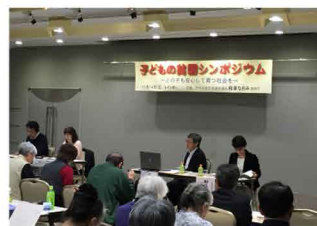
2015年11月に開催した「子どもの貧困シンポジウム」

7人にひとりの子が相対的貧困。「子育てチーム」をつくって、アンケート、他区への聞き取り・調査活動などを通じて、様々な提案をおこなってきました。