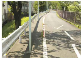
↓ 道路に立つ街路灯を外に