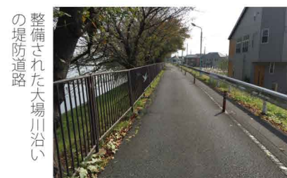
整備された大場川沿いの堤防道路