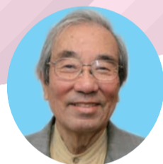
公明党元副委員長 二見 伸明