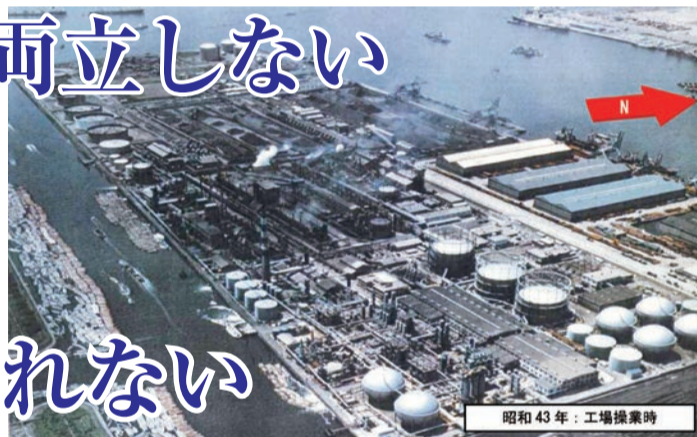
東京ガス製造工場操業時の写真。タールやヒ素など大量の有害物質が土壌深く染み込みました。

豊洲市場は「無害化」の見通しすらたっていません。知事は、専門家会議が提言した「追加対策」を施すといいますが、この「対策」は、汚染土壌が残ることを前提としたもの。「追加対策」で安全が確保されるかのようにいうのは、事実と反します。